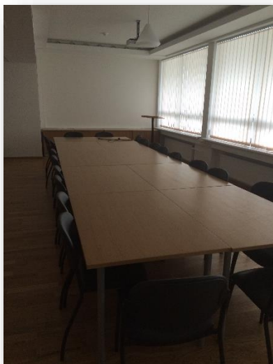
Pilt 1 ÜE koolitusruum 228