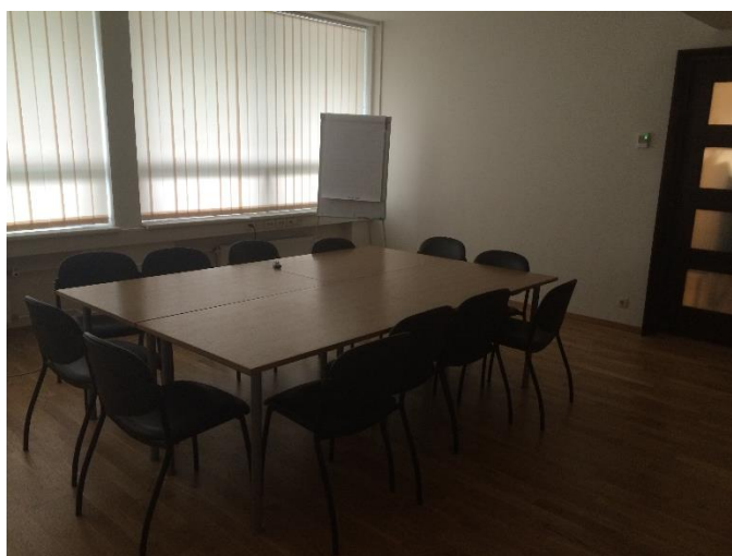
Pilt 2 ÜE koolitusruum 227