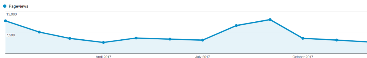
Joonis 1 www.ttu.ee/tudengile analüütika 01.01.2017 - 31.12.2017